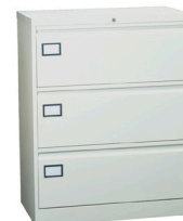
Flansskåpen har mindre djup, lämpliga på trånga utrymmen.

Kraftiga expansioner i lådorna med 100% utdrag och testade för över 80.000 utdrag med 50 kg belastning. Lådorna har handtag i hela lådans bredd och en integrerad etikettdisplay på lådfronten. Önskas andra färger? Kontakta oss för pris & leveranstid.