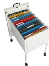
Trolley A4 med lock & lås.

Trolley A4 - Open: Utv. H: 670 B: 380 D: 600